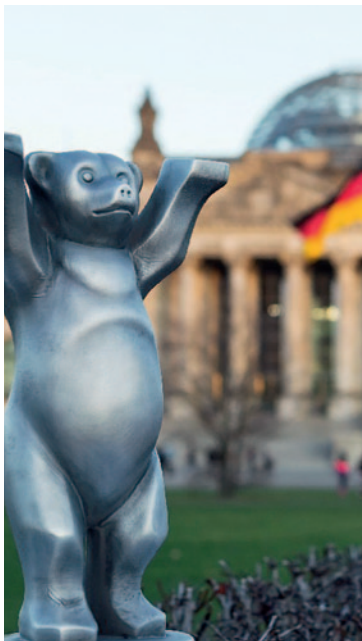
1585_ Silberner Berliner Bär