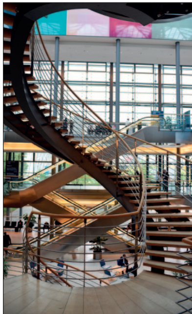
1592_OT 2022 - 3. und letzter Tag