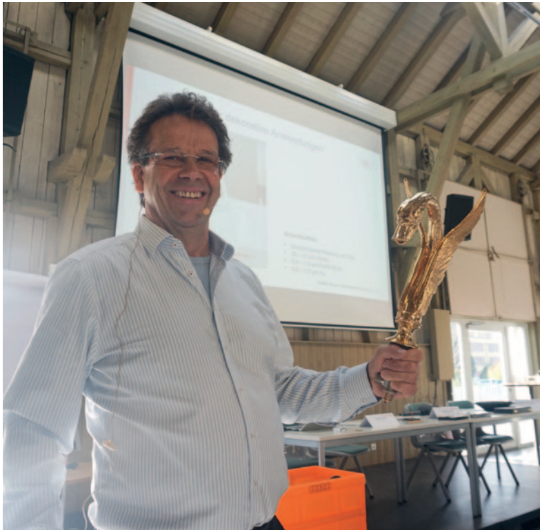
1600_ Gold im Blick beim Z.O.G. in Schwäbisch Gmünd