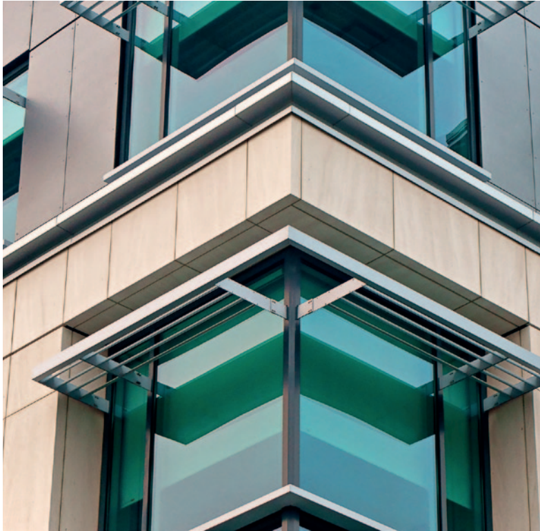
1646_ Direktgalvanisieren von Aluminium