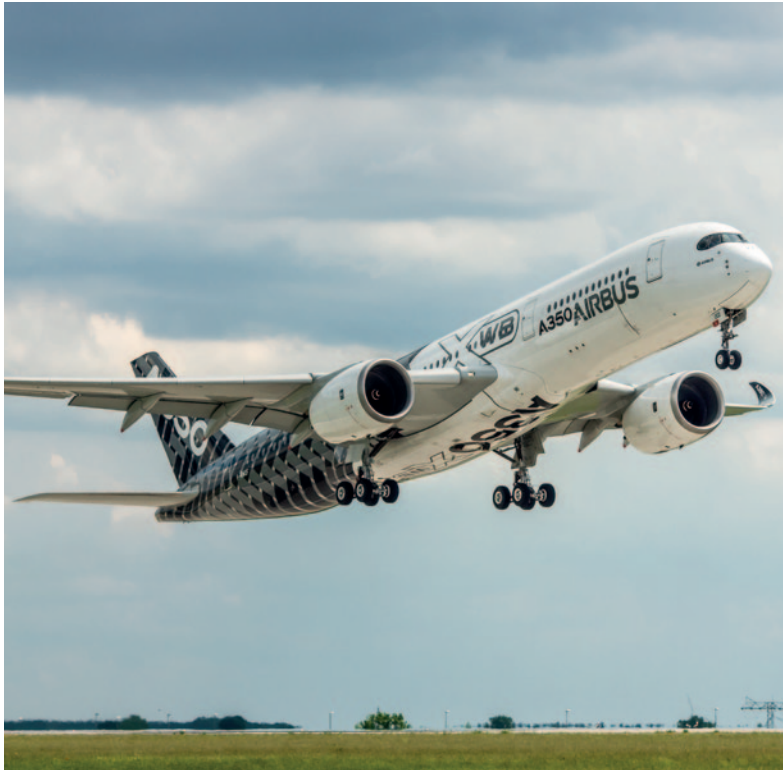
62_ Fahrwerke für Flugzeuge