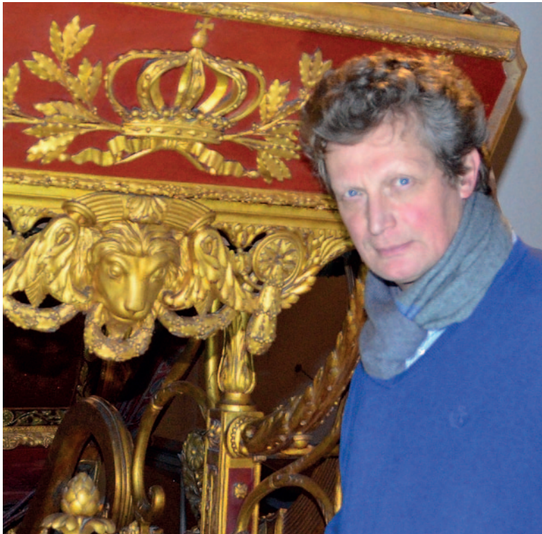
62_ Neuer Glanz für alte Karossen