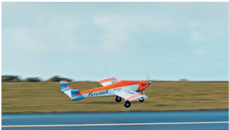
68_ Lieferdrohne hebt ab